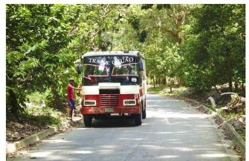
Alle Transfers mit dem Tour-Bus