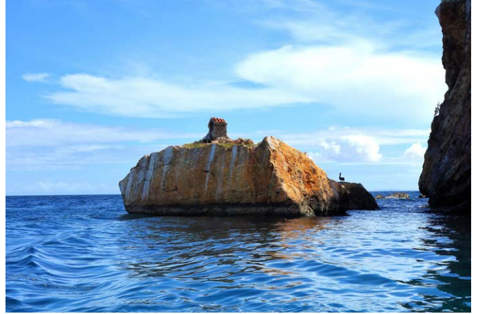
Mochima-Nationalpark – Karibikparadies