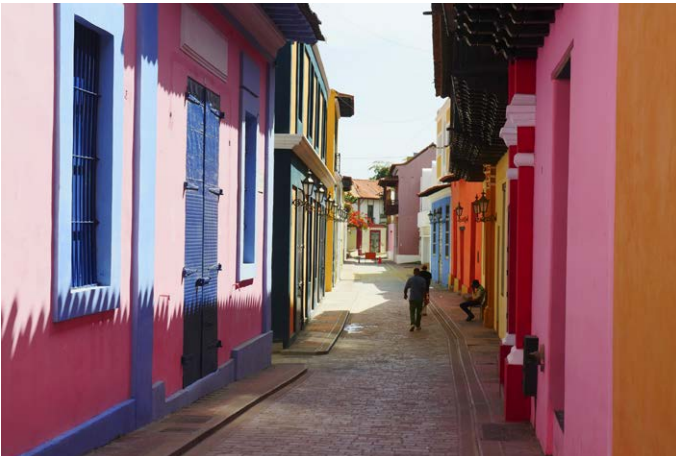
La Guaira – Abschluss im historischen Hafen