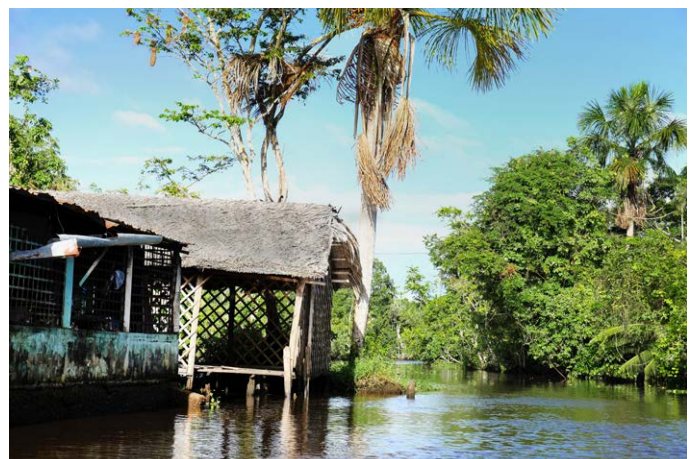
Orinocodelta – Im Labyrinth aus Wasser und Wald