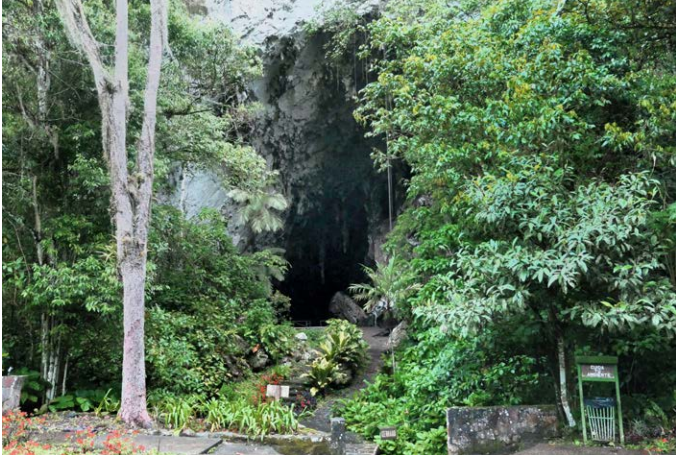
Caripe – Humboldthöhle und Kaffee