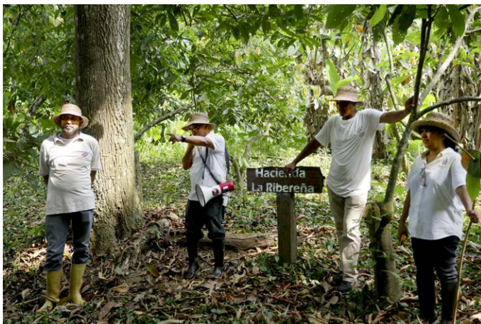
Barlovento – Kakao und Karibik