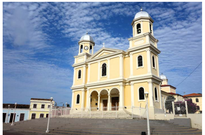
Cumaná – Wo Humboldt seinen Fuß auf südamerikanischen Boden setzte