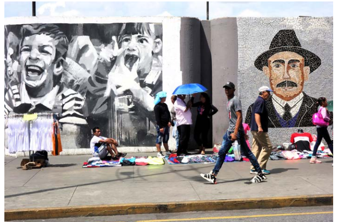
Eintauchen in die Geschichte und Kultur