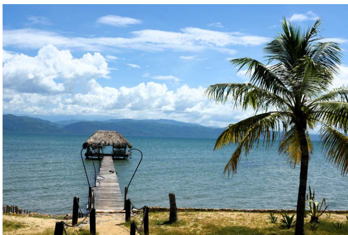
Carúpano – Rum, Schokolade und Traumstrände